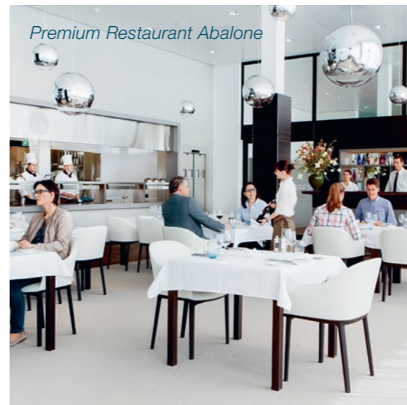
Premium Restaurant Abalone

La palestra è un complemento valido all'offerta di terapie e attività sportive e ricreative. Per le terapie riabilitative differenziate sono inoltre disponibili un campo di beach volley all'aperto, nonché una parete di arrampicata al chiuso e una all'aperto. Queste opportunità di esercizio ludico-sportive rappresentano un momento di svago per i pazienti e uno strumento terapeutico efficace.