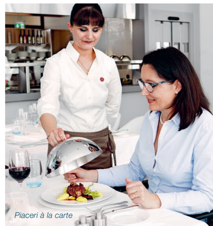
Piaceri à la carte